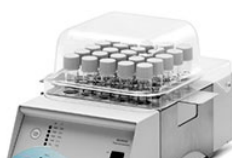
VELP ECO 25 терморектор