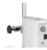
VELP ES верхнеприводная мешалка