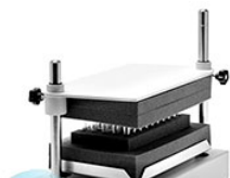
VELP MULTI-TX5 вортекс многопробирочный