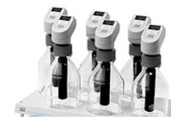
VELP Respiriometric 6 Maxi BMP