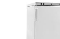
VELP FTC 120 охлаждающий инкубатор