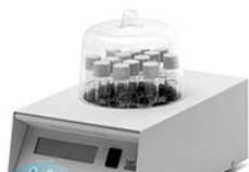
VELP ECO 16 терморектор