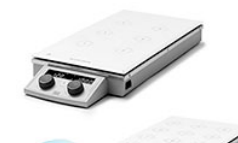
VELP MULTI-HS 6/15 Digital многопозиционная магнитная мешалка с подогревом