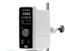
VELP OHS 200 Digital верхнеприводная мешалка