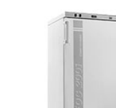
VELP FOC 200I Connect охлаждающий инкубатор