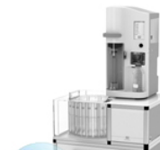
VELP UDK 169 — автоматический паровой дистиллятор с титратором и автосемплером