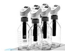
VELP Respiriometric 6 Sensor для биоразлагаемости пластика