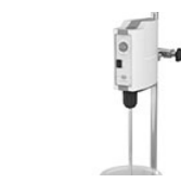
VELP LH верхнеприводная мешалка