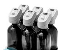
VELP респирометрические анализаторы с датчиками для измерения БПК