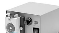
VELP SP 311 перистальтический насос