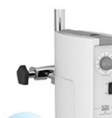
VELP LS верхнеприводная мешалка