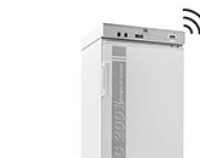
VELP FOC 200IL Connect охлаждаемый инкубатор с подсветкой