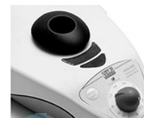
VELP WIZARD IR вортекс для пробирок