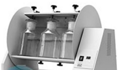
VELP ROTAX 6.8 верхнеприводный миксер