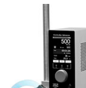
VELP Advance контроллер