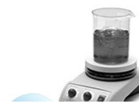
VELP AREX магнитная мешалка с подогревом