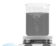
VELP AREX-6 магнитная мешалка с подогревом