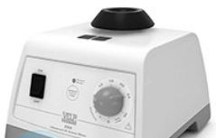
VELP ZX4 вортекс для пробирок