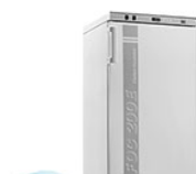
VELP FOC 200E Connect охлаждающий инкубатор