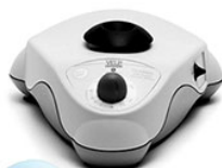
VELP CLASSIC вортекс для пробирок