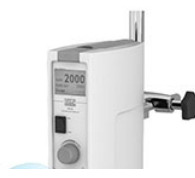
VELP DLS Digital верхнеприводная мешалка