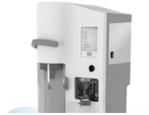
VELP UDK 159 — автоматический паровой дистиллятор со встроенным титратором