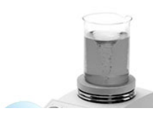
VELP ARE-6 магнитная мешалка с подогревом