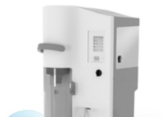
VELP UDK 139 — полуавтоматический паровой дистиллятор