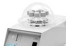
VELP ECO 8 терморектор