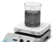
AREC.T Digital VELP (15л, таймер, 550°C) — магнитная мешалка