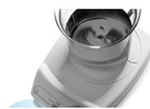
VELP ESP ультраплатная магнитная мешалка