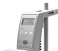
VELP VTF цифровой терморегулятор