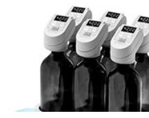
VELP Respiriometric 6 Sensor BOD