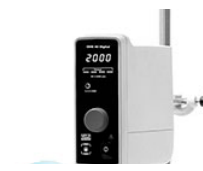
VELP OHS 40 Digital верхнеприводная мешалка