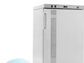
VELP FOC 120E Connect охлаждающий инкубатор