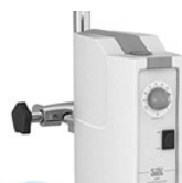
VELP PW верхнеприводная мешалка