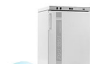
VELP FOC 120I Connect охлаждающий инкубатор