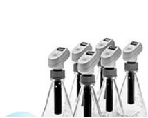
VELP Respiriometric 6 Sensor для анализа почвы