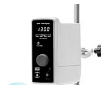
VELP OHS 100 Digital верхнеприводная мешалка