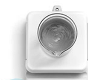
VELP AREC. X Digital магнитная мешалка с подогревом