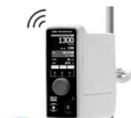
VELP OHS 100 Advance верхнеприводная мешалка