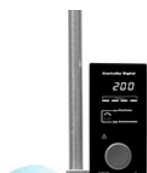
VELP Digital контроллер