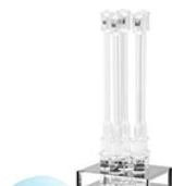
VELP ECO 6 терморектор