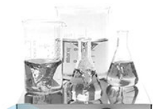
VELP MULTISTIRRER Digital 6 магнитная мешалка