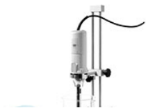
VELP OV5 гомогенизатор