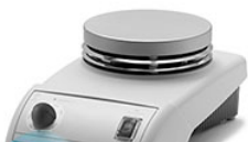
VELP RC нагревательная плита