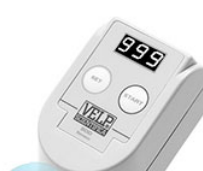
VELP респирометрический датчик для измерения БПК