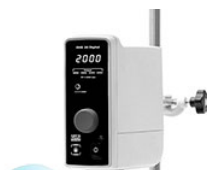
VELP OHS 20 Digital верхнеприводная мешалка