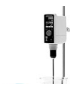
VELP OHS 60 Advance верхнеприводная мешалка