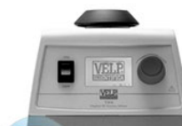
VELP TX4 вортекс для пробирок