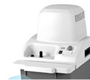
VELP JPV вакуумный насос с рециркуляцией воды