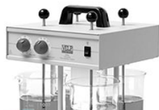
VELP FP4 портативный флокулятор