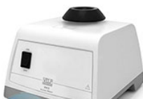
VELP RX3 вортекс встряхиватель для пробирок