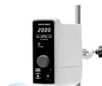
VELP OHS 60 Digital верхнеприводная мешалка