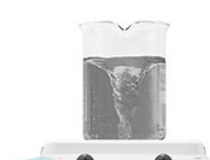
VELP HSC магнитная мешалка с подогревом