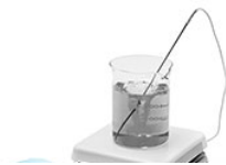
VELP AREC Connect магнитная мешалка с подогревом