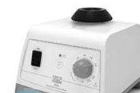
VELP ZX3 вортекс для пробирок