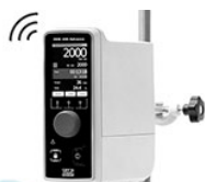
VELP OHS 200 Advance верхнеприводная мешалка