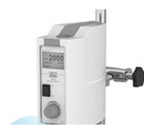
VELP DLH Digital верхнеприводная мешалка