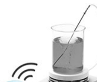
VELP AREX-6 Connect PRO магнитная мешалка с подогревом